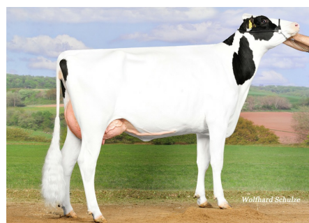
Belladonna GP-84 Küper, Schwienau