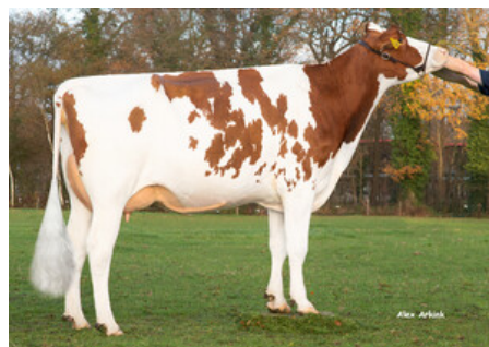
M: Sanderij Massia Saskia

→ TOP-EXTERIEUR, SPITZENEUTER MIT LÄNGEREN STRICHEN