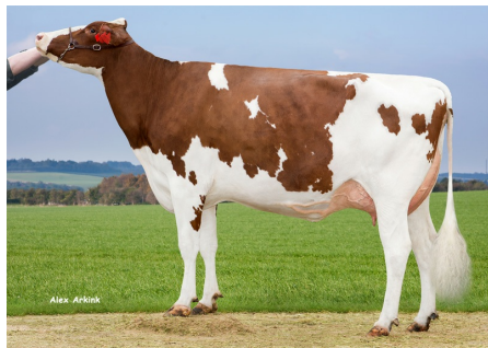
M: Boisvert SPH Saigon Dänemark