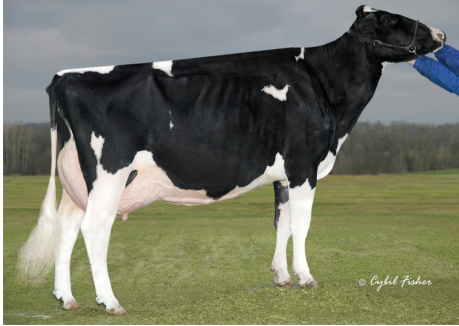
UGM: Budjon-JK Dur Esquisite EX-92