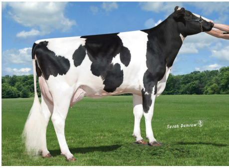
M: Blue Horizon Plan Edith VG-85