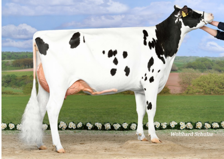
Ina P VG-85