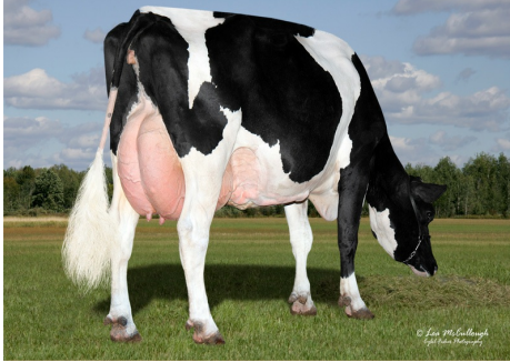
UGM: Aurora Iota 11727