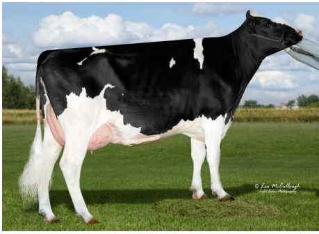
GM: Aurora Mayfield 13965